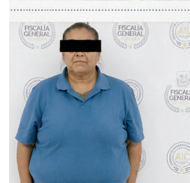
La mujer era buscada por presuntas violaciones a la libertad condicional relacionadas con tráfico de personas y narcóticos.

nado entre la Policía Estatal de Coahuila y la Agencia de Investigación Criminal.