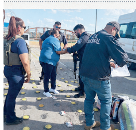
El INM realizó una deportación controlada para entregarla a autoridades de Estados Unidos.