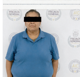
La mujer era buscada por presuntas violaciones a la libertad condicional relacionadas con tráfico de personas y narcóticos.

nado entre la Policía Estatal de Coahuila y la Agencia de Investigación Criminal.