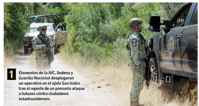
1 Elementos de la AIC, Sedena y Guardia Nacional desplegaron un operativo en el ejido San Isidro tras el reporte de un presunto ataque a balazos contra ciudadanos estadounidenses.