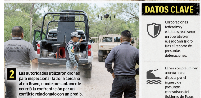
2 Las autoridades utilizaron drones para inspeccionar la zona cercana al río Bravo, donde presuntamente ocurrió la confrontación por un conflicto relacionado con un predio.

DATOS CLAVE Corporaciones federales y estatales realizaron un operativo en el ejido San Isidro tras el reporte de presuntas detonaciones. La versión preliminar apunta a una disputa por el ingreso de presuntos contratistas del Gobierno de Texas