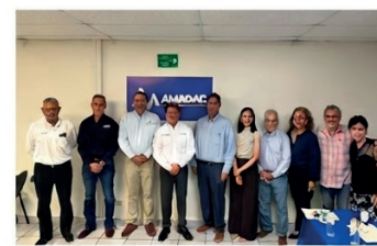
FOTO 1: Representantes de cámaras empresariales en la reunión con el presidente de Ports to Plains.

Durante la conferencia se informó sobre una inversión proyectada de 32 billones de dólares en Texas, de los cuales, de acuerdo con la