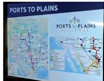
FOTO 3: Mapa del proyecto Ports to Plains Alliance y la ruta fronteriza.

información presentada, ya se han invertido 1.5 billones.