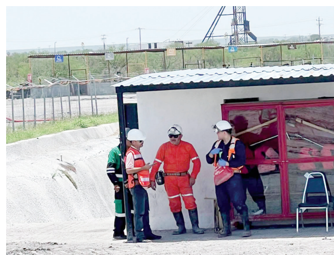
Las autoridades mantienen el proceso de recuperación e identificación para garantizar la entrega digna de los restos a las familias.

Juan de Sabinas, lo más importante es que vienen estos empleos, externo. Agregó que su administración continuará impulsando las condiciones necesarias para atraer más