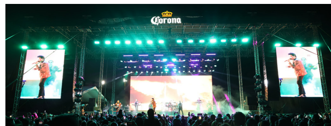
El Biblioparque Norte alberga actividades para todas las edades, desde transmisiones deportivas hasta juegos y espacios gastronómicos.