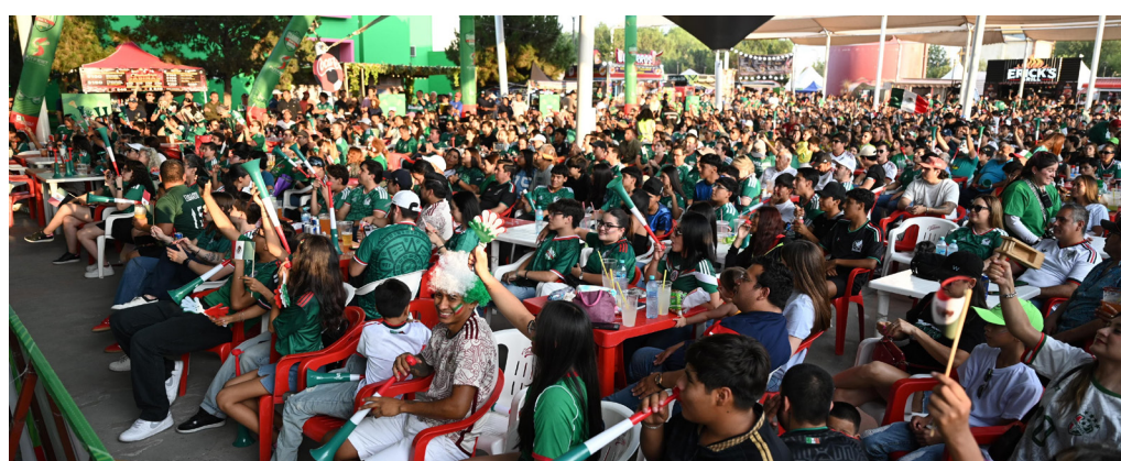
Familias de Saltillo y visitantes disfrutaron de las actividades deportivas, musicales y recreativas que ofrece el FUTFEST 2026.

Añadió que este tipo de iniciativas fortalecen el tejido social, fomentan la convivencia comunitaria y generan espacios de encuentro para las familias tanto de Saltillo como de otras ciudades que visitan