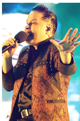
Los conciertos y espectáculos artísticos se han convertido en uno de los principales atractivos del festival.