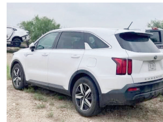
La droga fue localizada oculta en un doble fondo dentro del tablero de una camioneta SUV Kia con placas de Coahuila.

De acuerdo con la autoridad del condado, la droga fue localizada oculta en un doble fondo fabricado en el