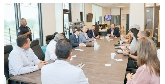
La reunión se realizó en las oficinas del Puente Internacional II de Eagle Pass.