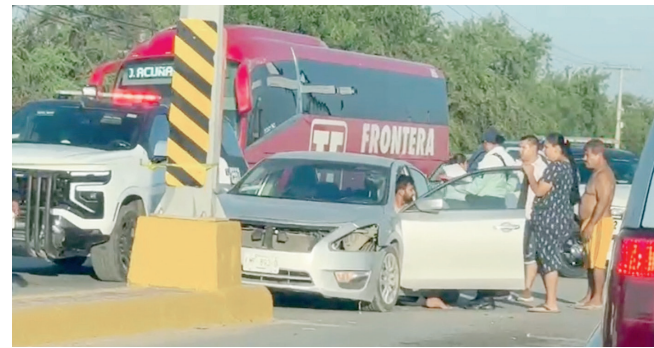
La Fiscalía investiga la omisión de consignar ante el Ministerio Público un accidente en el que estuvo involucrada la patrulla 2533 de la Policía Municipal.