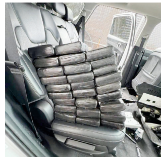
Autoridades del condado de Maverick aseguraron más de 30 kilos de cocaína durante un operativo carretero.