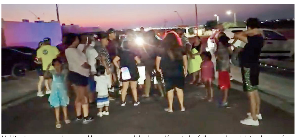
Habitantes permanecieron en el lugar como medida de presión ante las fallas en el suministro de energía.