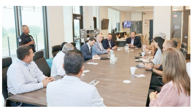
La reunión se realizó en las oficinas del Puente Internacional II de Eagle Pass.