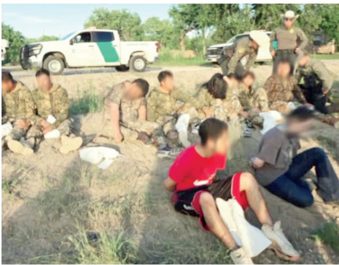
Agentes de la Patrulla Fronteriza aseguraron a 10 migrantes tras una persecución vehicular en Eagle Pass, Texas.