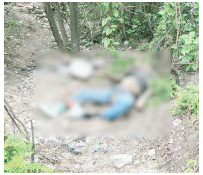
Elementos de la AIC y Servicios Periciales realizaron el procesamiento del lugar donde fue localizado el cuerpo en Villa Campestre.