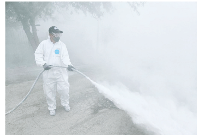
Personal de la Jurisdicción Sanitaria 01 realizó labores de fumigación y saneamiento en colonias afectadas por las recientes inundaciones en Piedras Negras.