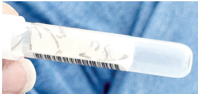
Personal de salud realizó cercos sanitarios en diversas colonias tras la notificación de casos probables de dengue.