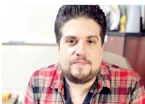
Los ocho casos sospechosos investigados durante la semana pasada fueron descartados por laboratorio.

La Jurisdicción Sanitaria 01 informó que los ocho casos probables de dengue detectados la semana pasada resultaron negativos. Autoridades mantienen vigilancia ante las recientes lluvias