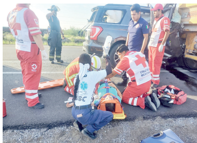
Paramédicos de Cruz Roja y socorristas de Escobedo trabajaron para rescatar a los sobrevivientes del fatal accidente.

La pesada unidad provenía del municipio de Nava y tenía como destino Ramos Arizpe cuando ocurrió el encontronazo.