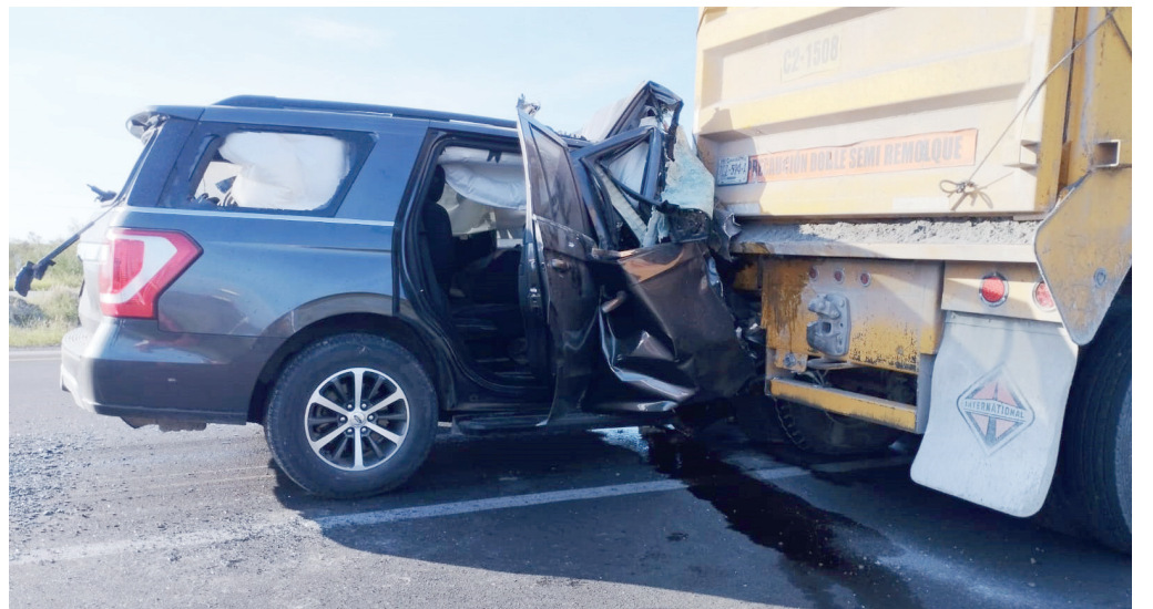
Dos personas murieron prensadas entre los fierros retorcidos de la camioneta.