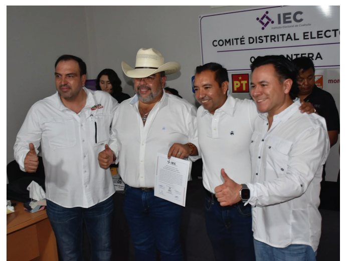
El documento fue entregado tras concluir el cómputo y recuento de votos realizado por el Comité Distrital Electoral del IEC.

El Gobierno de Coahuila y las secciones 5, 35 y 38 del SNTE acordaron instalar mesas permanentes de trabajo para dar seguimiento a las demandas del magisterio