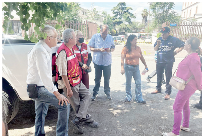
Alrededor de diez personas solamente llegaron para apoyar al petista.

Guerra se negó a abandonar su lugar en el pleno pese a que la Presidencia del Congreso le requirió en tres ocasiones que acatará la determinación aprobada por el Poder Legislativo.