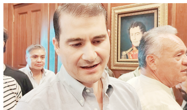
El Subsecretario General de Gobierno de Coahuila, Diego Rodríguez.