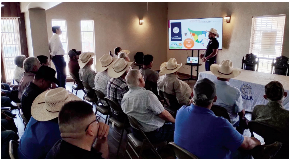
Reciben ganaderos información.

Orientan a ganaderos sobre prevención y detección de la miasis en el ganado