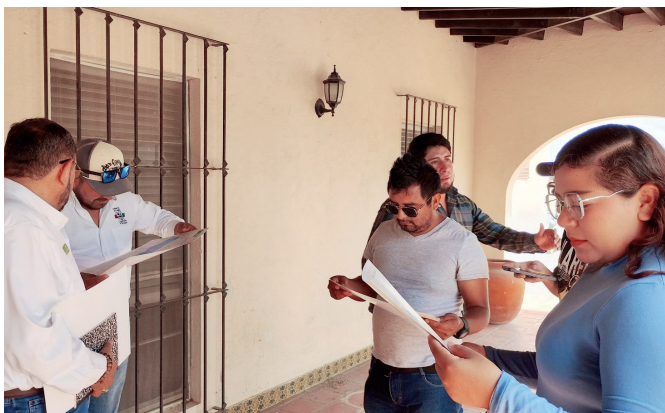
Programarán revisiones del ganado local.

Durante la exposición se explicó a los productores la