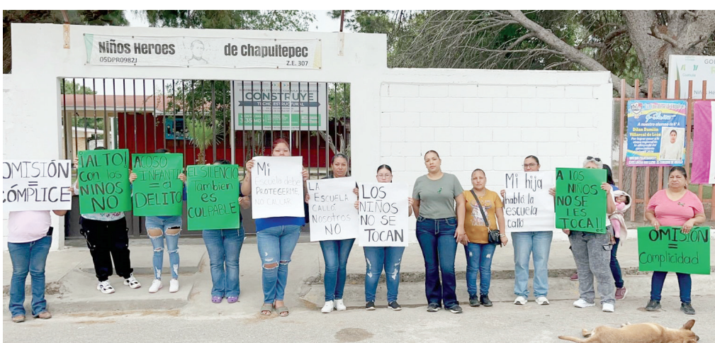
Madres de familia mantienen tomadas las instalaciones de la Escuela Primaria Niños Héroes de Chapultepec.

La denuncia señala que una menor de 10 años habría sido víctima de tocamientos indebidos durante una excursión escolar organizada por el plantel