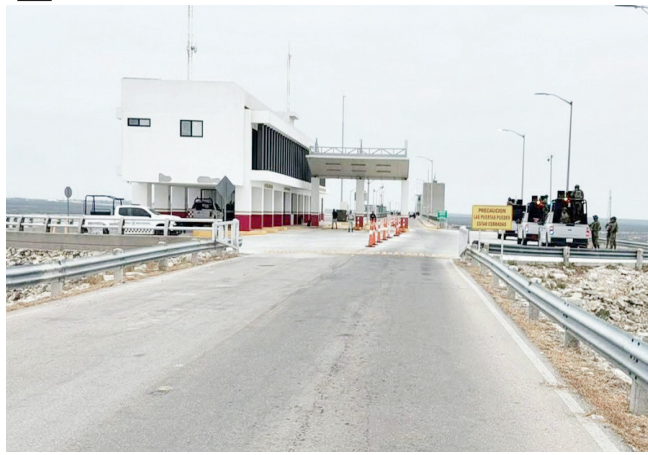
Extienden cierre del cruce por la Presa de la Amistad.