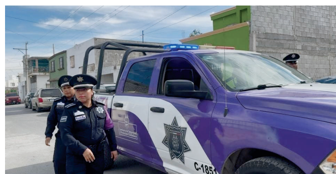
La Comisaría de Seguridad y Protección Ciudadana mantiene líneas de apoyo especializadas para mujeres en situación de riesgo.

la Unidad de Integración Familiar, UNIF, que atiende violencia de género y la cual se puede contactar a través del 844-410-4003.