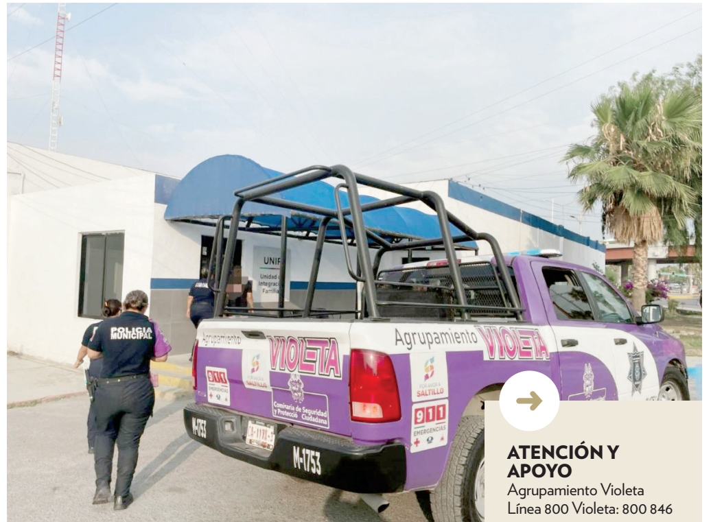
Violencia física, psicológica, sexual, económica y patrimonial son algunos de los casos que atienden las autoridades.

La Comisaría informó que también se cuenta con