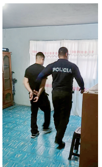
Autoridades municipales exhortaron a denunciar cualquier caso de violencia contra la mujer y recordaron los canales de atención disponibles.

Agrupamiento Violeta Línea 800 Violeta: 800 846 5382 UNIF: 844-410-4003 Tipos de violencia atendidos Física Psicológica Sexual Económica Patrimonial Canales de emergencia Emergencias: 9.1.1 Policía Municipal: 844-414-1114 Chat Bot de Seguridad: 844-893-0909 Objetivo Brindar atención inmediata Orientación y acompañamiento Fortalecer la prevención de violencia de género