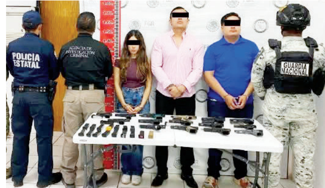
Los jóvenes detenidos ya fueron consignados ante la FGR.