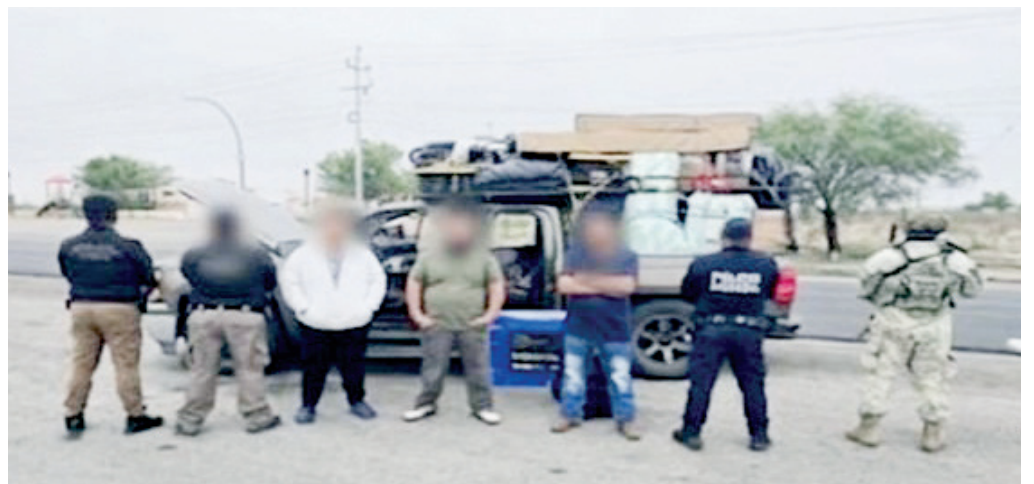
Fuerzas federales y estatales incautan armas de fuego y detienen a tres en Progreso, Coahuila.