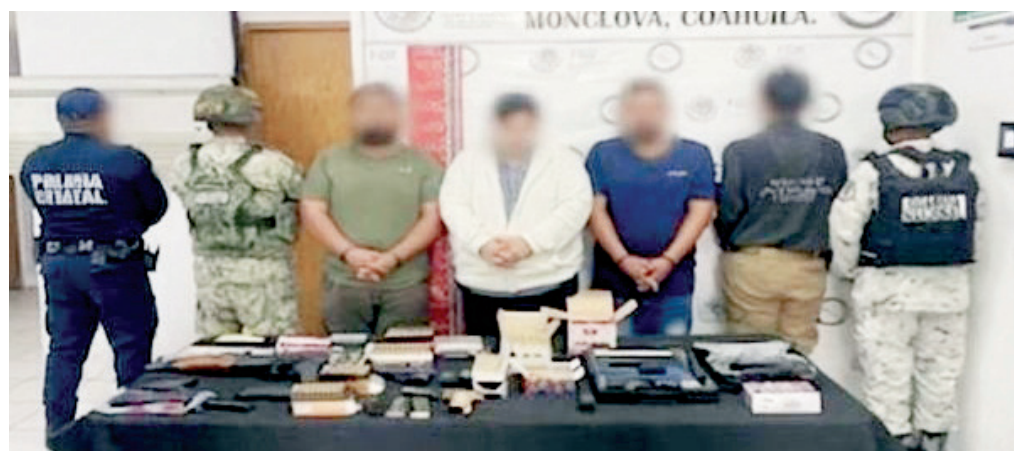
Las personas arrestadas y lo asegurado fueron puestos a disposición de la autoridad competente.