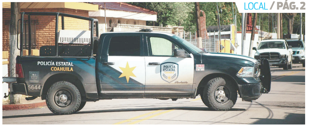
Judicializan a detenidos tras operativo en local "Greens 4:20"