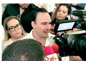
El gobernador de Coahuila, Manolo Jiménez Salinas,

Señaló que Coahuila mantiene condiciones de seguridad, pero insistió en no bajar la guardia y fortalecer controles en la selección de candidatos.