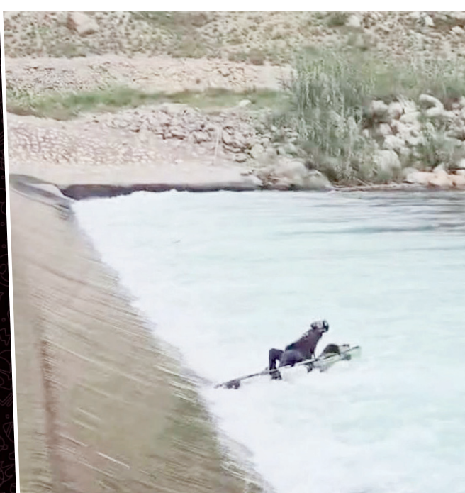
"Influencer" dentro sin chaleco salvavidas.

ponde a una zona federal de difícil acceso para corporaciones de auxilio, lo que complicó la atención oportuna.