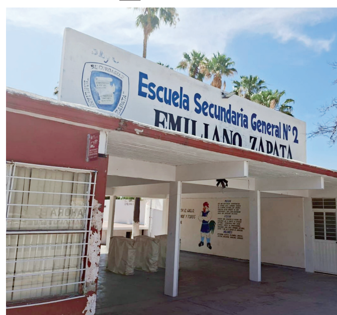
La secundaria volvió a ser señalada por la falta de control interno.

La Policía Municipal intervino y aseguró al estudiante de primer año tras los hechos ocurridos el pasado viernes al interior del plantel educativo; padres exigen "Operativo Mochila"