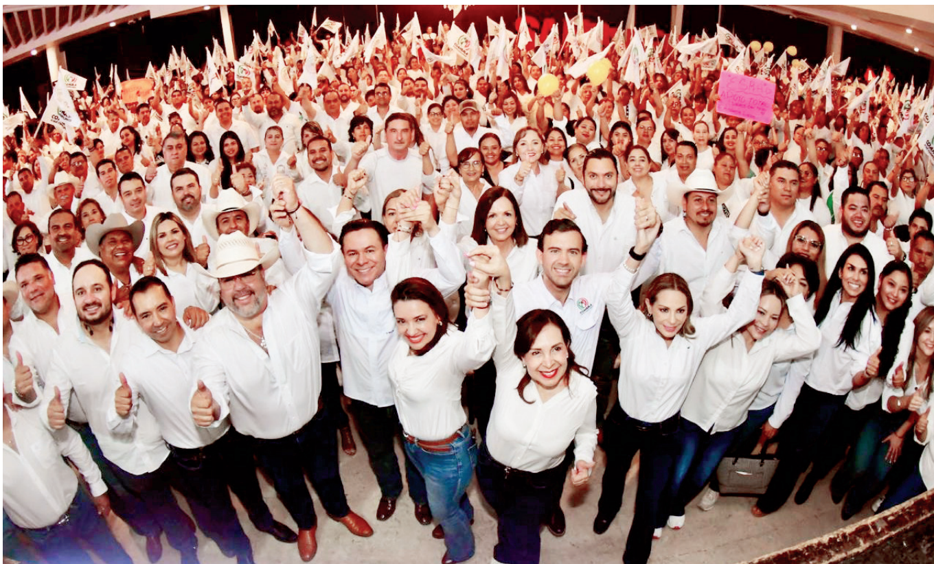
Militantes del PRI respaldaron a sus candidatos durante la toma de protesta en la región Centro-Desierto.

El partido mostró unidad y estructura rumbo a las elecciones del 7 de junio de 2026, con registros ante la autoridad electoral