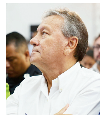
Autoridades estatales y municipales durante el arranque de la estrategia de seguridad en Coahuila.