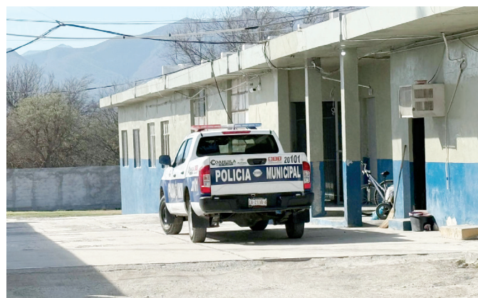
El individuo fue puesto tras las rejas.