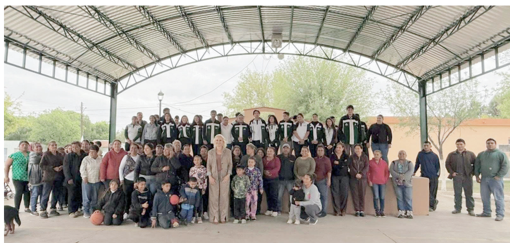
Habitantes de Minas La Florida, cuentan ya con una techumbre en su comunidad.

Durante el evento, habitantes de la comunidad reconocieron el trabajo realizado por la edil en cada uno de los minerales, comunidades rurales y propiamente en la cabecera municipal. La alcaldesa destacó que este tipo de acciones res-