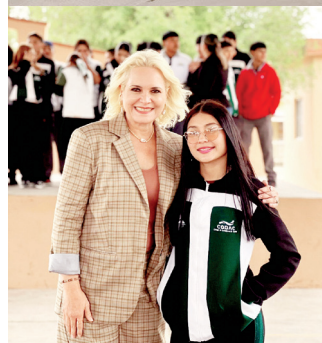
La edil sigue cumpliendo compromisos en el Pueblo Mágico de Múzquiz.

promiso de trabajar de la mano con la ciudadanía para mejorar la calidad de vida en cada rincón del municipio.