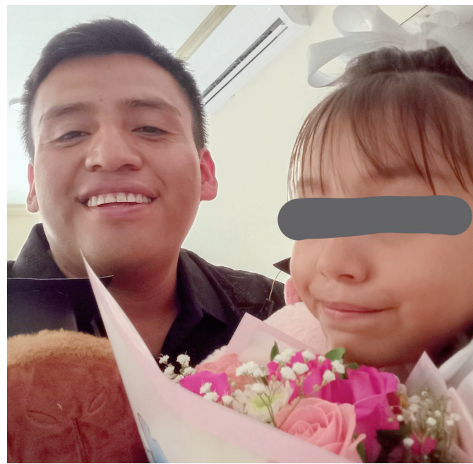
Padre denuncia maltrato infantil, amenazas y presunta complicidad institucional en Monclova

Un caso de presunto maltrato infantil, amenazas y abuso de autoridad ha encendido las alertas en la región Centro de Coahuila, luego de que un padre de familia denunciara públicamente que su hija de seis años vive en condiciones de violencia física, descuido y abandono,