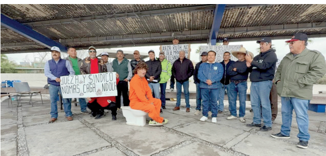
Obreros responsabilizan al sindico por no vigilar