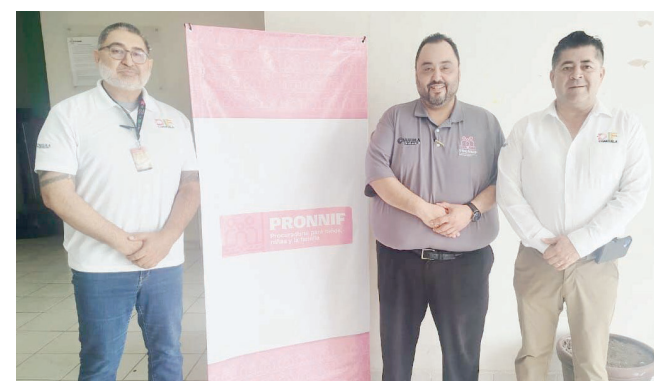
Sostienen reuniones dependencias de menores.

Con estas mesas de trabajo, las dependencias buscan mantener vigilancia constante y atención oportuna, priorizando el bienestar y desarrollo de la niñez en Ciudad Acuña.