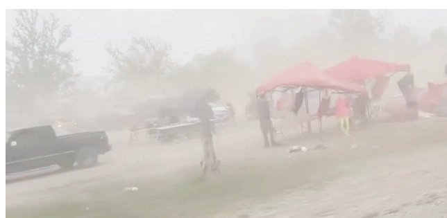
Zona presenta daños tras paso de frente frío.