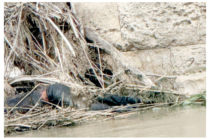
La víctima fue localizada boca abajo y con una bolsa de pertenencias, donde se encontró una identificación colombiana.

Autoridades indicaron que será hasta la realización de las investigaciones correspondientes cuando se confirme de manera oficial la identidad de la persona, así como la causa del