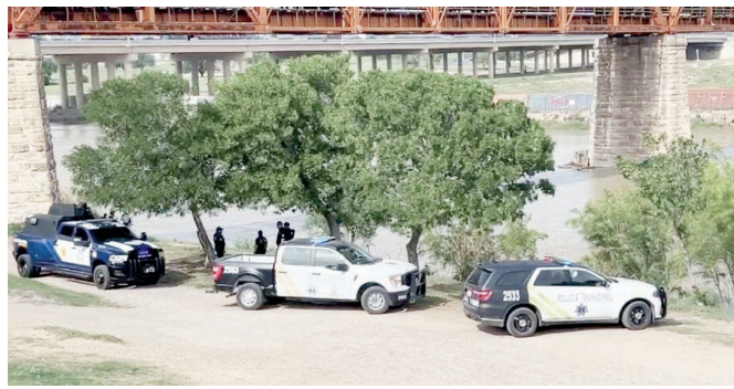
Elementos de Seguridad Pública acordonaron el área tras el hallazgo del cuerpo entre la maleza del "Puente Negro".

Elementos de Seguridad Pública ubicaron el cuerpo