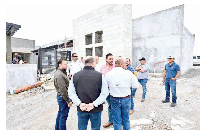
El alcalde Carlos Villarreal supervisó el avance del Centro Integral de Seguridad en Monclova.