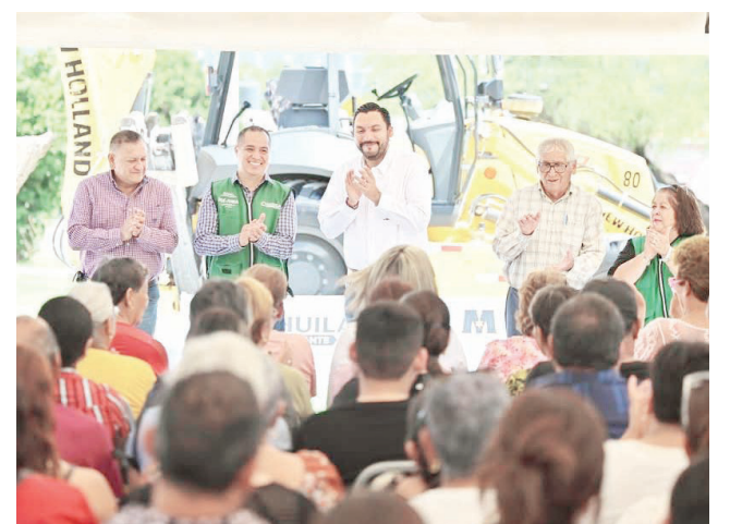
Inicia la rehabilitación de una plaza para fortalecer la convivencia familiar en la comunidad.