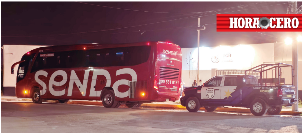
La unidad 8219 fue asegurada en un filtro de la carretera 57 durante el operativo.

Más de 8 mil pastillas de metanfetamina fueron localizadas dentro de una mochila en el área de equipaje