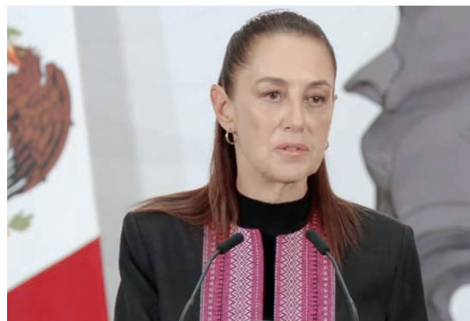
La Presidenta destacó que además México ya consume gas no convencional que proviene de Texas

té de Expertos formado por miembros de la UNAM, la UAM, el IPN y otras instituciones que tienen dos me-