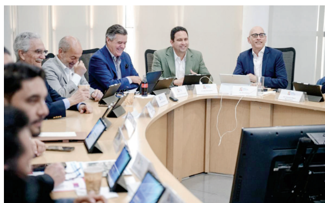
Anuncian incremento en el caudal de agua como parte de acciones contra la sequía.