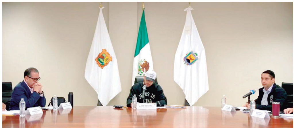
Regidores frenaron la compra del terreno ante la falta de estudios técnicos y claridad sobre el precio por metro cuadrado.

El debate escaló cuando el secretario del Ayuntamiento reveló que ya existían gestiones avanzadas