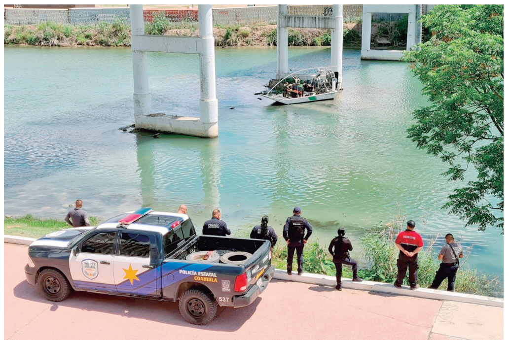
La necropsia de ley y los estudios periciales buscarán establecer tanto la causa del fallecimiento como la identidad de la víctima.