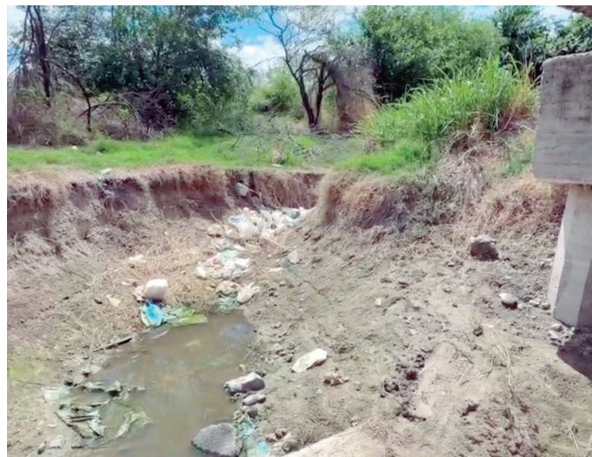
El predio propuesto presenta zonas inundables y un arroyo, según denunciaron ediles durante una inspección en el sitio.