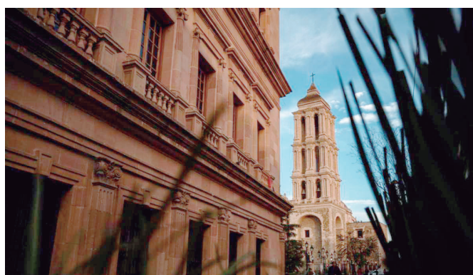
Invitan a votar por Saltillo y Pueblos Mágicos en premios turísticos nacionales e internacionales.

que favorezcan la sostenibilidad, impulsando la economía local y el aporte socio-comunitario.