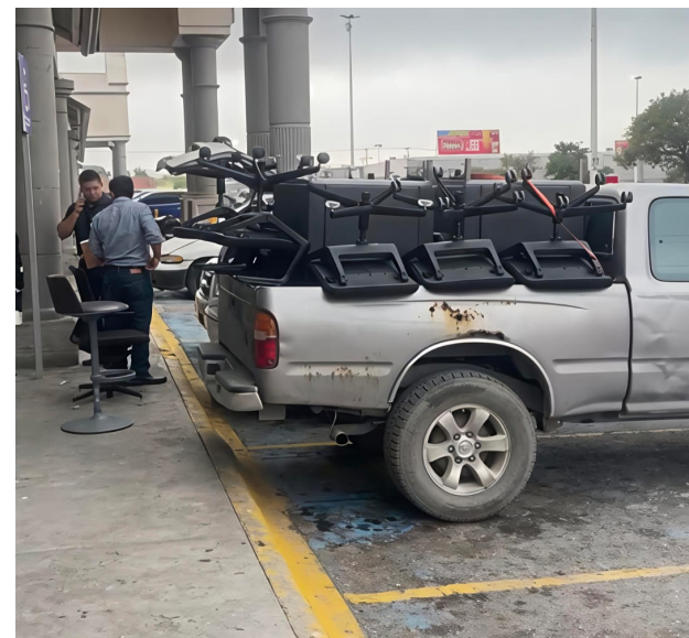
Actuario y representantes legales realizaron el embargo en la sucursal Lourdes de Banamex en Saltillo.

STAFF / LA VOZ www.periodicolavoz.com.mx