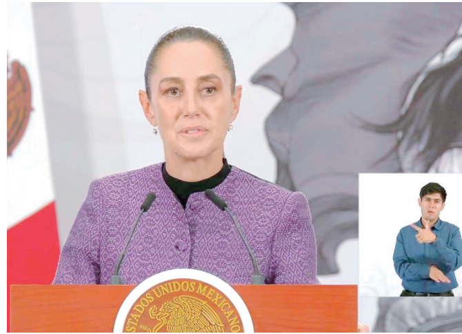
Sheinbaum reconoce crisis por cierre de AHMSA en Monclova

Sheinbaum aseguró que su gobierno mantiene atención sobre el conflicto y en-