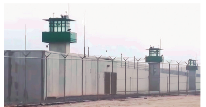
Interno es hallado sin vida en celda del penal de Mesillas.