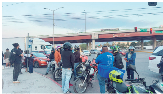
Elementos policiacos resguardan el acceso a la comandancia durante el cierre temporal tras los momentos de tensión.

El hecho derivó en un ambiente de hostil que obligó a los elementos po-