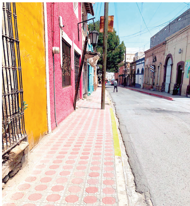
Casas antiguas de adobe presentan mayor vulnerabilidad ante humedad y falta de mantenimiento.