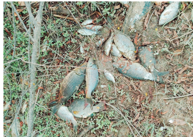
Confirman mortandad de peces en áreas del río Sabinas.