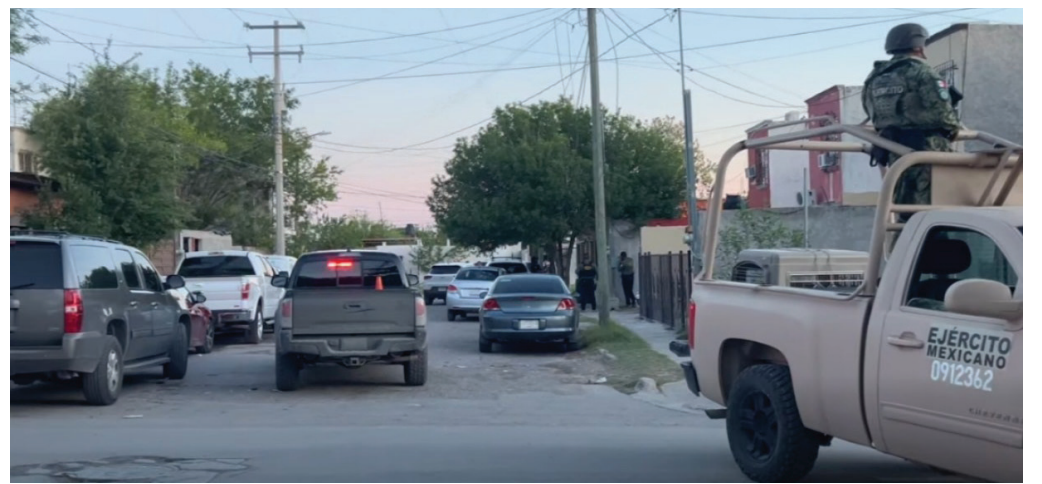
Cateo en Piedras Negras deja dos detenidos y objetos asegurados.

PIEDRAS NEGRAS, COAH. - Un cateo ejecutado la noche del lunes en un domicilio del sector Año 2000 dejó como saldo dos personas detenidas, además del aseguramiento de jeringas, aparatos electrónicos y otros indicios relacionados con presuntos delitos contra la salud.