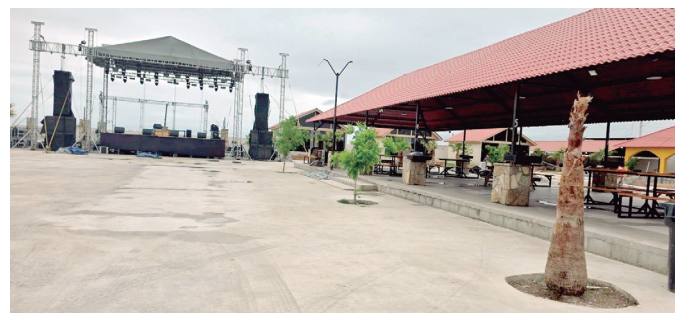
Realizan comunicado tras clausura.

numerosas para volver a un esquema dirigido a eventos familiares y privados.