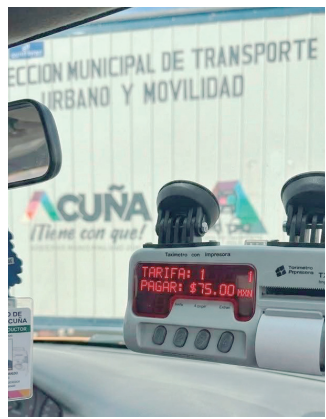
Se presenta posibilidad del uso del taxímetro.