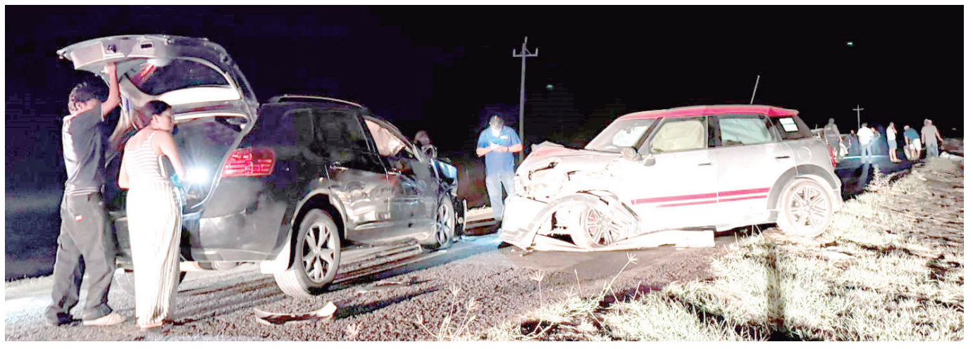
El accidente se registró sobre la carretera estatal número 20, tramo Múzquiz-Boquillas del Carmen, poco antes de llegar al río.

Elementos del Mando Coordinado de Seguridad Pública Municipal, al man-