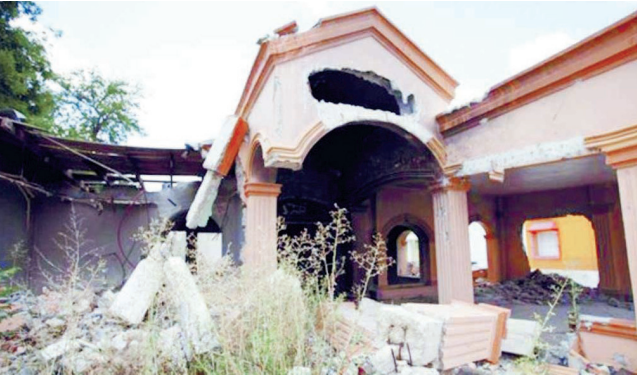
Respecto a investigaciones de alto impacto, el funcionario confirmó que el caso del exlíder criminal conocido como “Z-40” es uno de los más representativos que se mantienen abiertos.