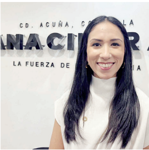
Presentan nuevo equipo de trabajo.

tación oficial de la mesa directiva que encabezará los trabajos en este nuevo periodo, García Altamirano delineó las prioridades de su gestión, entre ellas la generación de más empleos y el impulso a proyectos productivos que consoliden el crecimiento industrial en la ciudad.