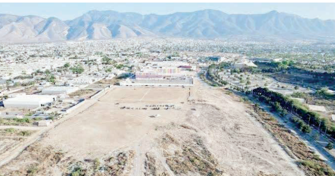
El nuevo Hospital Regional brindará cobertura a aproximadamente 936 mil derechohabientes y ofrecerá servicios en 34 especialidades médicas.