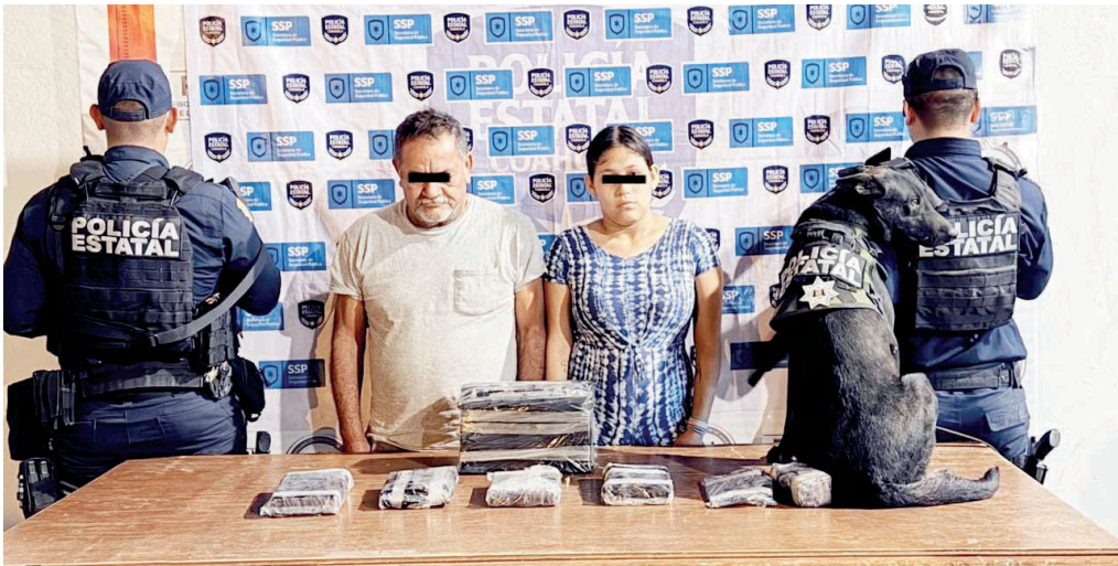
Elementos de la Policía Estatal detuvieron a dos personas por transportar narcóticos en la Carretera Federal 2.

De acuerdo con el reporte oficial, los individuos viajaban a bordo de una camioneta tipo pick up Chevrolet color blanco, con placas de Tamaulipas, cuando fueron interceptados por