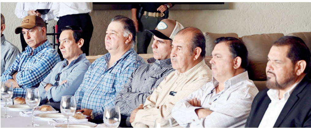
Comerciantes participan en sesión del Consejo Empresarial.