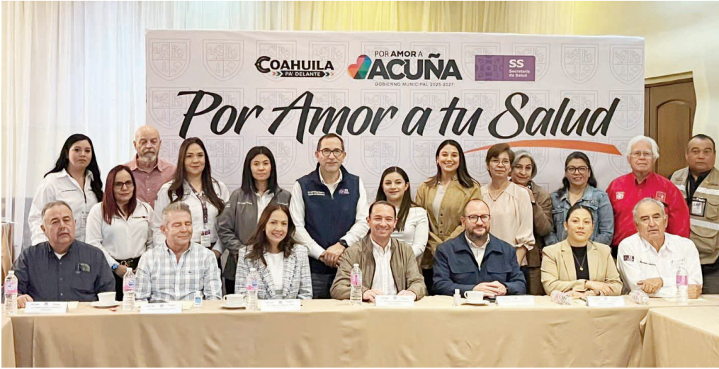
Sostienen reuniones de salud.

Durante una reunión de salud, se informó que, aunque actualmente existen casos positivos, la incidencia ha disminuido de manera significativa gracias a las estrategias implementadas desde 2024 en coordina-