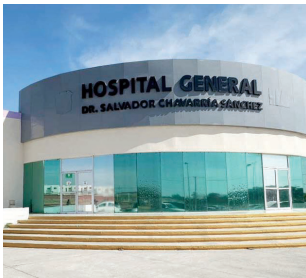
El Hospital General Dr. Salvador Chavarría mantiene consulta diaria de Psiquiatría y atención de urgencias para pacientes en crisis.

“Seguimos con los programas de salud mental. Aquí contamos con psiquiatra en el turno vespertino, está consultando todos los días. Es