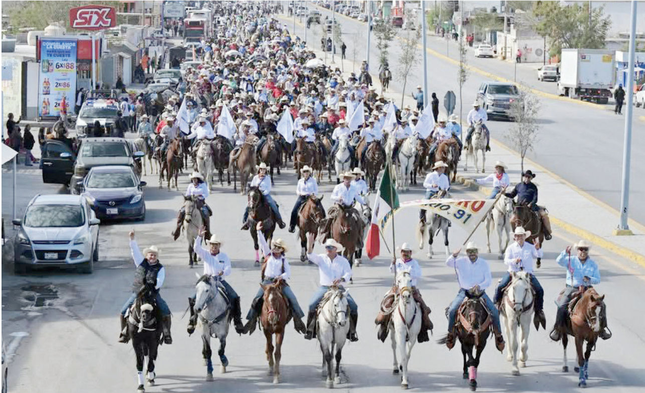
El aniversario del ejido El Oro se ha consolidado como una verdadera fiesta popular.