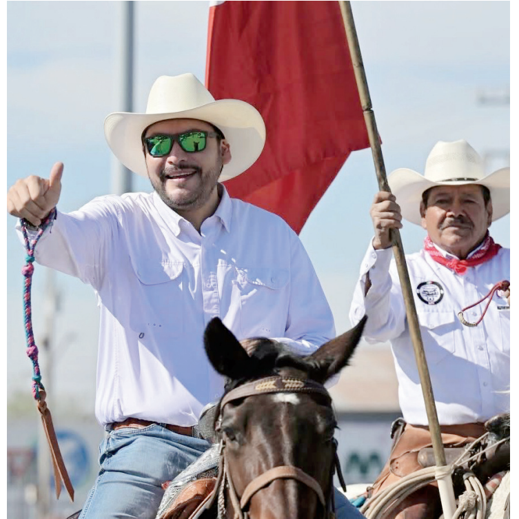
“Las cabalgatas representan nuestras raíces, la unión de nuestras comunidades”, dijo el Alcalde.