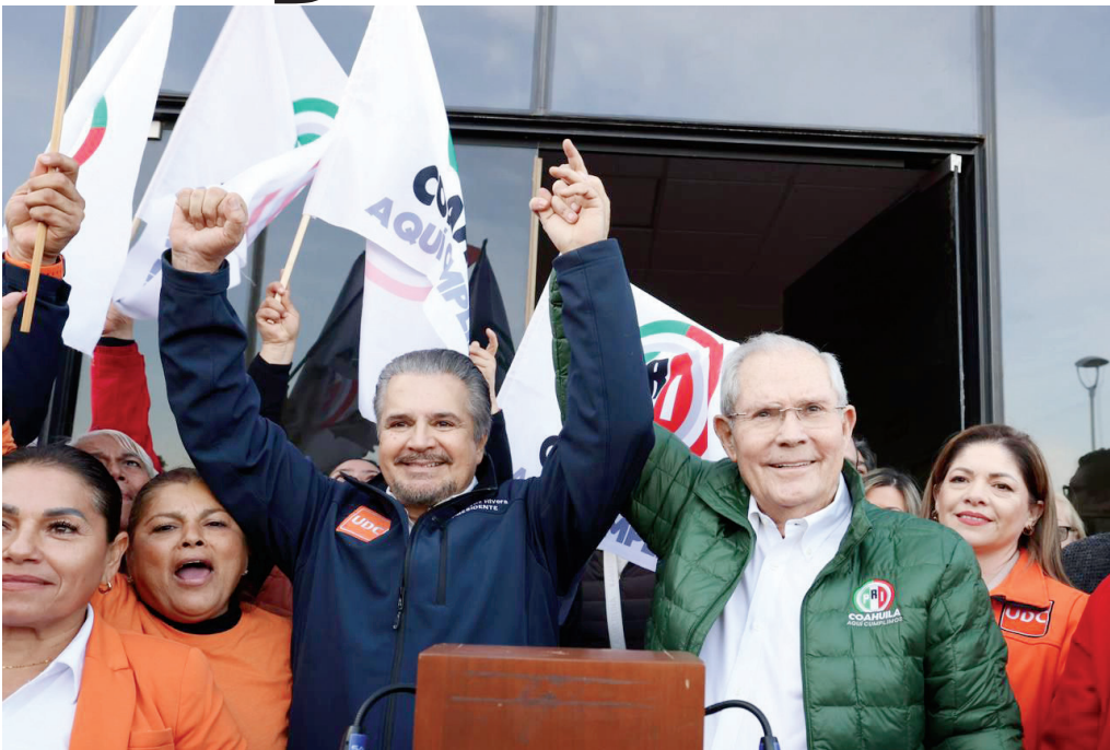
PRI y UDC formalizan convenio de coalición rumbo al Congreso del Estado de Coahuila.

Saltillo, Coah.— El día de hoy, ante más de 500 militantes y simpatizantes de todo el estado, el Partido Revolucionario Institucional (PRI) y Unión Democrática de Coahuila (UDC) formalizaron la entrega del convenio de coalición con el que buscan ratificar la mayoría y