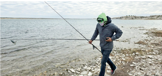
Pesca puede ser peligrosa.