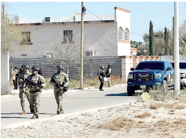
Presencia de corporaciones durante el cateo en locales comerciales.

NAVA, COAH. – Una intensa movilización de corporaciones de los tres órdenes de gobierno se registró al mediodía del sábado en el municipio de Nava, tras un cateo realizado en varios locales comerciales ubicados sobre la calle Ignacio Allende número 1105, al poniente