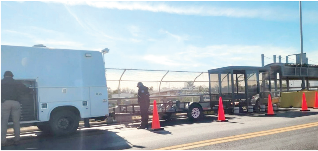
Vuelve punto de control en el puente internacional.

gen hacia Estados Unidos. El módulo de revisión fue colocado a unos metros después de la caseta del lado mexicano, donde elementos de seguridad permanecen realizando inspecciones a los viajeros y sus vehículos, como parte de un operativo que se