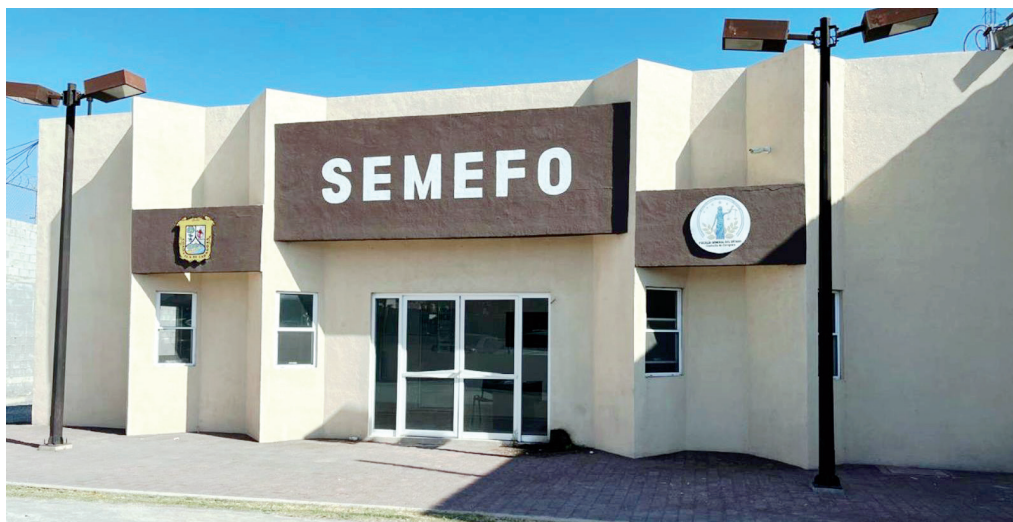
El cuerpo del menor fue trasladado al SEMEFO para realizar la necropsia de ley correspondiente.