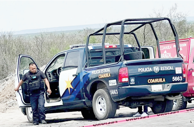
Las autoridades policiacas mantienen un operativo en el área para recabar indicios.