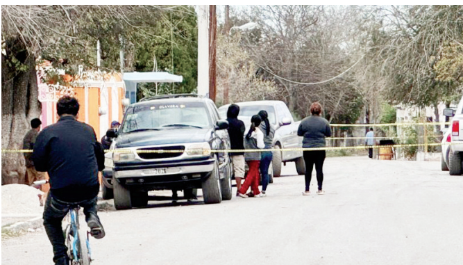
Estos lamentables hechos se registraron en la Villa de Palaú.