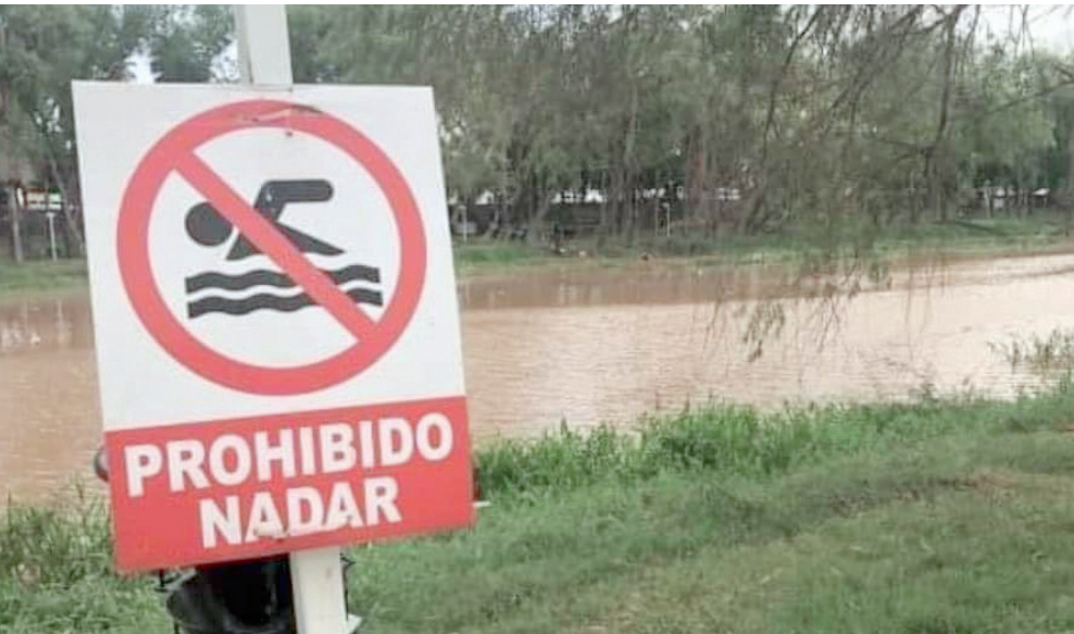
Aumentará el cauce del Río Bravo durante cuatro días.

CIUDAD ACUÑA, COAH. - El nivel del río Bravo registrará un incremento durante al menos cuatro días en su paso por Ciudad Acuña, debido a una extracción programada de la presa La Amistad, informaron autoridades de Protección Civil. El aumento en el flujo de agua generará niveles superiores a los habituales, por lo que se implementarán rondines de vigilancia