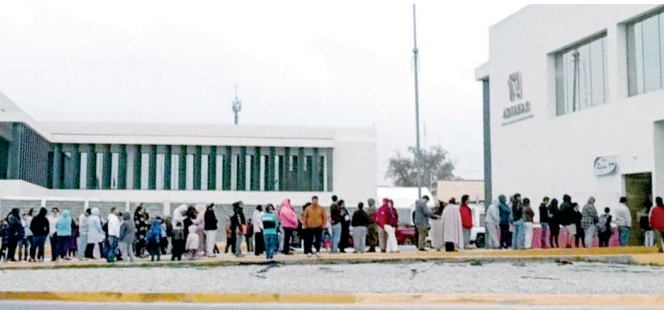
Largas filas en Banjercito Piedras Negras.

bién está experimentando congestionamiento debido a la gran cantidad de paisanos que se dirigen a México. Los viajeros deben tomar precauciones y planificar su viaje con anticipación. Es importante verificar los requisitos y horarios de atención de las oficinas de Banjercito antes de salir. El módulo de Banjercito en Piedras Negras es el único lugar donde se pueden tramitar los permisos de internación para la región de los Cinco Manantiales, por lo que se espera una gran afluencia de personas en los próximos días. Se recomienda a los paisanos que lleven comida, agua y snacks para evitar contratiempos. También es importante tener paciencia y prepararse para largas esperas.