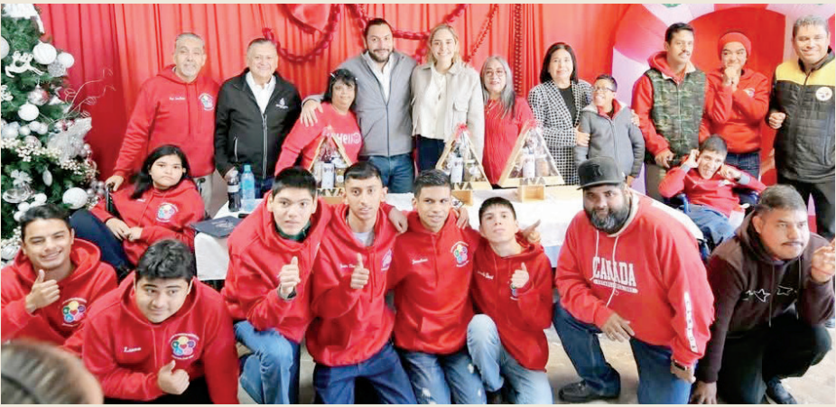
El Gobierno Municipal impulsa programas permanentes orientados a la inclusión.